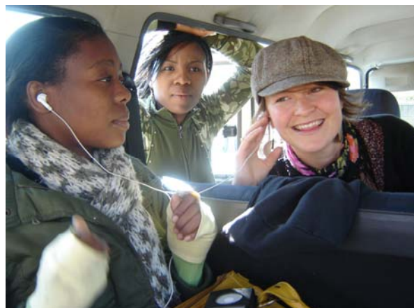
Unga kvinnor utbyter kreativa uttryckssätt och verktyg för att jobba för jämställdhet i NBV: s samarbetsprojekt "Teater för förändring".

I slutet av skriften finner du tips på material från Folkbildningsrådet och hänvisningar till mer detaljerad information om projektet, liksom kontaktinformation till deltagande eldsjälar. Lycka till!