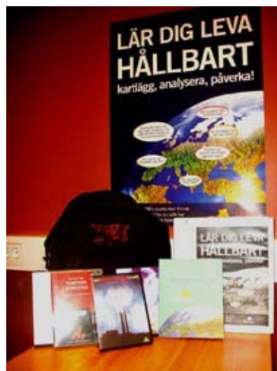
ABF Östergötland arbetar för att vi ska minska vår klimatpåverkan genom många kloka val i vardagen. Som verktyg används bl a studiecirklar och en ryggsäck full med filmer och annat material.

”Om vi inte ändrar riktning kommer vi hamna dit vi är på väg...” Därför vill ABF agera tillsammans med andra för att minska vår negativa klimatpåverkan. Ett mål är att östgötarna bidrar till detta genom långsiktigt hållbar livsstil, energiförbrukning och konsumtion. Ett annat mål är att var och en gör förbättringar som är realistiska utifrån det liv man lever. Ett hinder kan vara att vardagens mönster och slentrian är svåra att bryta. ABF arbetar genom att arrangera möten för samtal och för förändringsarbete. I en ABF-ryggsäck finns filmer, handledningar, artiklar, studiematerial m m för utlåning och inspiration.