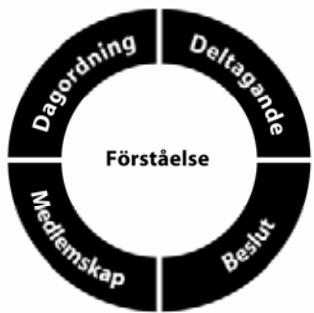
Faser i en beslutsprocess, enligt modellen "Demokratins ABC", utvecklad av DemokratiAkademien.