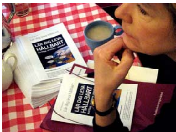
Eldsjälmarnas foldrar förstärkte den muntliga presentationen.