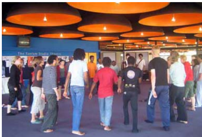
Teaterworkshop på Baxter Theatre, Kapstaden i Sydafrika.

Bilda anordnar en ”festival – samtal om livet – skaparverkstad” i Jerusalem som heter Dandanat, vilket betyder att ”humma” eller ”jamma” tillsammans. På Dandanat dansar, spelar och samtalar svenskar och palestinier med varandra för att bredda perspektiven hos kulturutövande ungdomar och ge deltagarna styrka. Det skapar svårigheter att inte kunna mötas fysiskt innan festivalen, men detta går att lösa genom möten på nätet där den politiska situationen inte påverkar. Svårflörtad publik lockas till arrangemangen genom att ha med mer av 2000-talets punk och hiphop. En ständig utmaning är hur man skapar rum för samtal utan att forcera ihop folk. Slutligen, en lärdom: Se möjligheterna inte hindren.