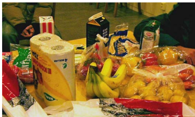
Södertörns folkhögskola började arbetet i aktionsgruppen med att handla en kasse mat och undersöka matens innehåll och ursprung.

Verksamhet kan presenteras på olika sätt. Under eldsjälsträffarna arbetade deltagarna fram en A5-folder som även kunde användas som en A3-poster och en PowerPoint-presentation. Mängd text och antal bilder var förutbestämda, liksom rubrikerna: Organisation; Titel; Tanken bakom; Mål; Strategi; Hinder – Lösning; Resultat – Lärdom; Person – roll, ledstjärna, citat. Texterna i det här avsnittet är utdrag från foldrarna som kan ses i sin helhet på Folkbildningsnätet (se s.14). Där finns även mallen om du själv vill använda formatet.