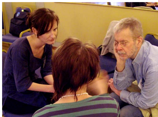
Gruppdiskussion under öppet forum.

Utvärderingarna visar att eldsjälmarna i ännu högre grad än vad som skedde önskade fördjupa sig i sina egna och de andras verksamheter. Att ge mer utrymme för att ifrågasätta och omformulera mål, strategi, hinder och lärdomar kan vara ett sätt att förbättra eldsjälsträffarna. Mer fri tid på kvällar och pauser för spontana samtal kring svåra situationer och hur man hanterat dem kan vara ett annat.