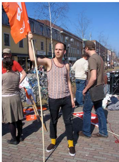
Inspirationsbild från Vindelns folkhögskola och projektet "Från Vindeln till världen".

Vindelns folkhögskola arbetar med klimatfrågan eftersom den berör oss alla. Det är viktigt för Vindeln att peka på de positiva alternativen och arbeta för att koppla det lokala till det globala. Två av målen i projektet är att öka kunskapen om klimatfrågan och tydliggöra kopplingarna mellan ekonomi och miljö. Som metoder använder man arbete i projektform, koppling till aktuell debatt och fria arbetsformer. Flera resultat har kommit ur projektet hittills, t ex ökad förståelse för frågeställningen och tillgång till nya verktyg och uttrycksmedel. Lärdomar för framtiden är vikten av långsiktighet och att gruppdynamik tar tid.