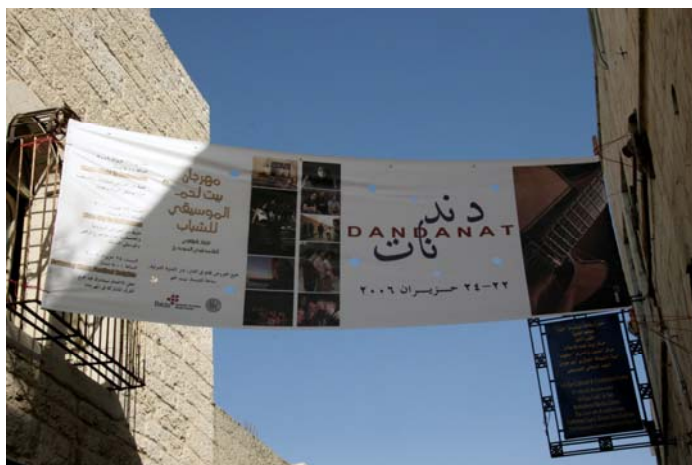
Kulturfestivalen Dandanat har som ett mål att människor ska mötas genom kulturella uttryck.