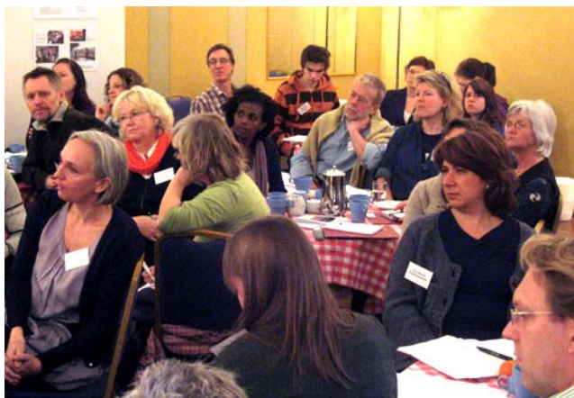
Koncentrerade lyssnare under berättarcaféet.

Tio eldsjälur som berättade tio minuter var om engagemang och erfarenheter skapade två timmars berättarcafé som låg till grund för resten av dagen. Varje berättelse innehöll både en personlig historia och konkreta fakta om verksamheten – hur mycket av varje var valfritt. På så sätt inleddes Inspirationsdagen med bilder från en mångfald av verksamheter. Rutiga dukar och kaffe på borden säkrade stämningen och de nyfikna deltagarna fångades omedelbart av inledningar som ... – När jag var liten såg jag en myra i julgranen. Mitt i vintern! – Jag är varm och svettig, står i damm och stekande sol och ser framför mig en tjej som gråter. – Apropå helvete, jag heter Ingegerd.