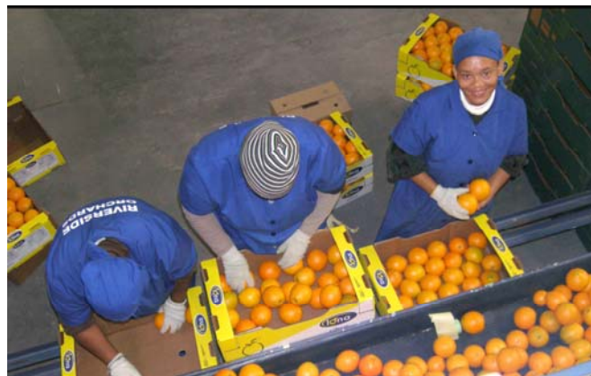
Nya rättvist handlade varor, här från River Side Farm, Fort Beaufort i Sydafrika.